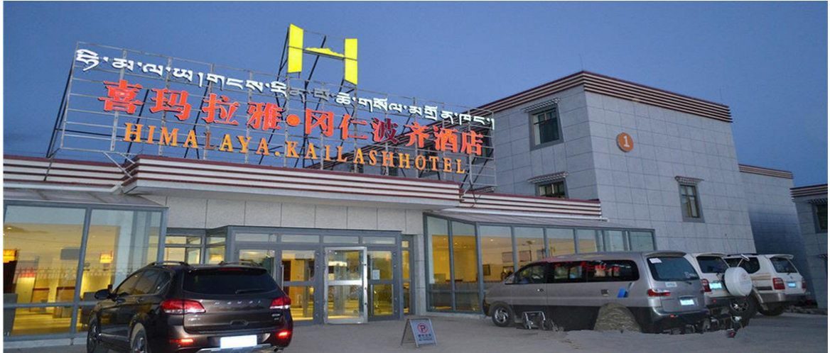
ที่พัก Dharchen Himalaya hotel

วันที่สิบสองของการเดินทาง เมืองดาร์เชน – เมืองซาจำ (เช้า/กลางวัน/-)