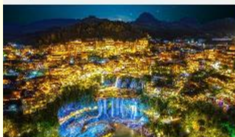
ฟูหลงเจิน