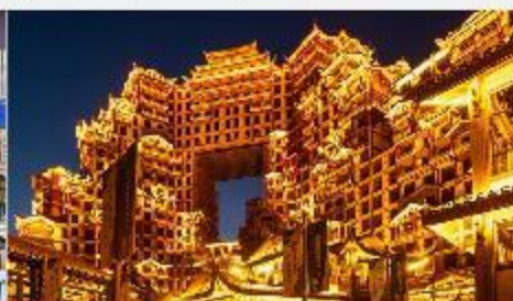
ตึกมหิศจรรย์ 72 ชั้น

*ทางบริษัทฯ ขอสงวนสิทธิ์ในการลิสโปรแกรมทัวร์ตามความเหมาะสมขึ้นอยู่กับสถานการณ์ปัจจุบัน โดยคำนึงถึงผลประโยชน์ของลูกค้าเป็นสำคัญ