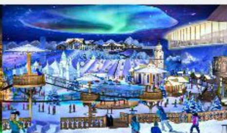
ICE AND SNOW WORLD