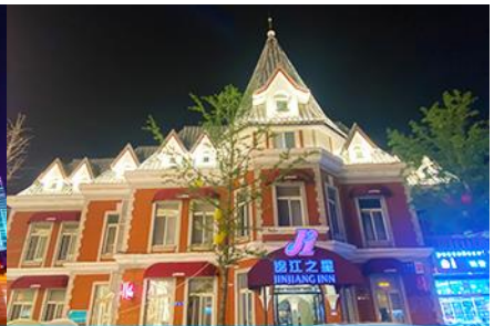
ถนนรัสเซีย