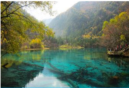
อุทยานจิวจี้โกว