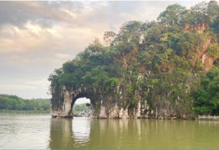
เขาวงช้าง