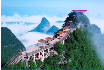
นั้งกระเช้าขึ้นเขาหฺรูยี้ฟง