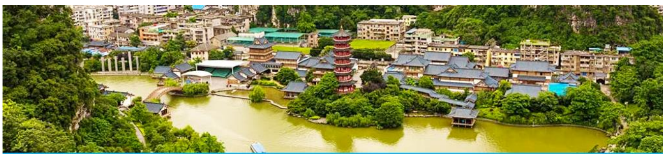
กุ้ยหลิน