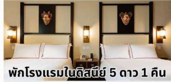
พักโรงแรมในดิสนีย์ 5 ดาว 1 คืน