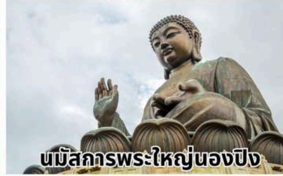
นมัสการพระใหญ่ของปิง