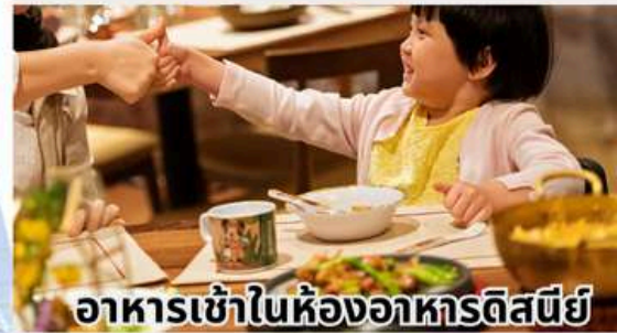
อาหารเข้าในห้องอาหารดิสนีย์