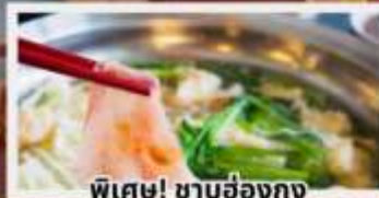
พิเศษ! ชาบูฮ่องกง