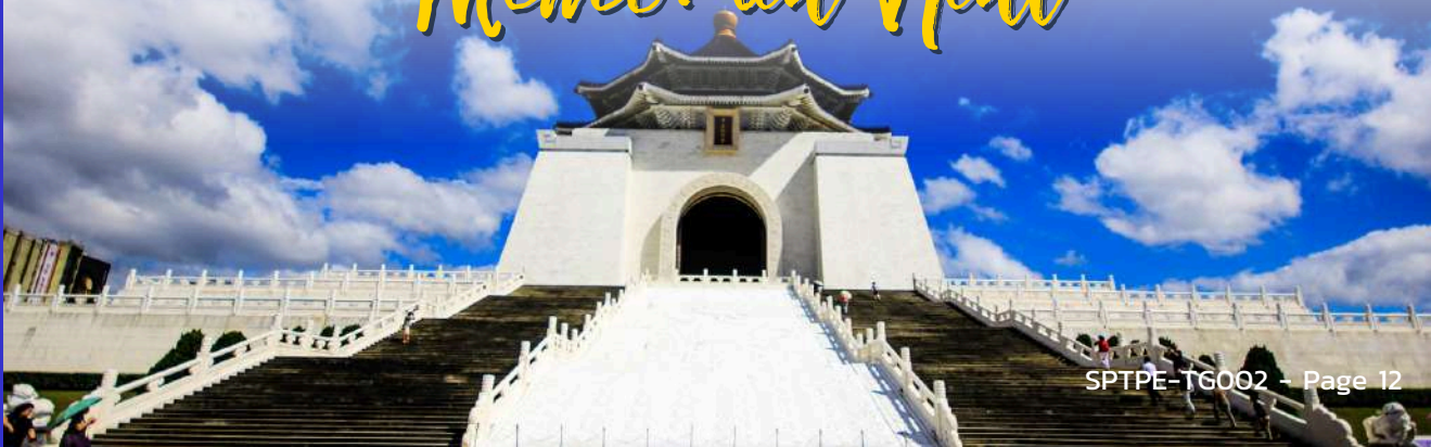
National Chiang Kai-Shek Memorial Hall

นำท่านเดินทางสู่ อนุสรณ์สถานเจียงไคเชก ตั้งอยู่ตรงใจกลางของเมืองไทเปที่มีพื้นที่ 2,500 ตารางกิโลเมตรแห่งนี้ถูกตกแต่งและประดับเป็นอย่างดี โดยตัวอาคารของอนุสรณ์สถานถูกสร้างขึ้นตามแบบสถาปัตยกรรมจีนโบราณ บันไดทั้งสี่ด้านถูกสร้างด้วยหินอ่อนสีขาวเป็นขั้นตามแบบพระมิดอียิปต์ หลังคาสีน้ำเงิน รวมทั้งยังมีสวนดอกไม้สีแดง ที่เป็นการแสดงออกทางสัญลักษณ์ให้เห็นถึงอิสรภาพ ความเท่าเทียม และความเป็นหนึ่งเดียวกัน ตามสีของธงชาติไต้หวัน สถานที่แห่งนี้นอกจากจะเป็นแลนด์มาร์คอันสำคัญของไทเปที่มีนักท่องเที่ยวมาเยี่ยมชมอย่างไม่ขาดสายแล้ว ยังเป็นโรงละครแห่งชาติและสถานที่สำหรับจัดคอนเสิร์ตของไต้หวันที่มีการแสดงจากศิลปินและนักร้องชื่อดังมากมายให้ผู้คนใจได้เข้าร่วมตลอดทั้งปี