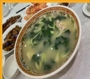
ซุปรังใส่หมู