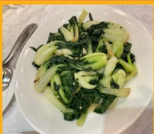
ผัดผักตามฤดูกาล