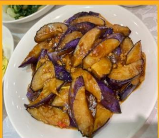
มะเขืออบหม้อดิน