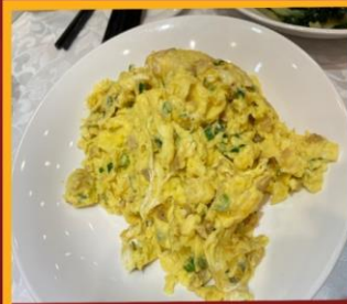
ไข่เจียวทรงเครื่อง