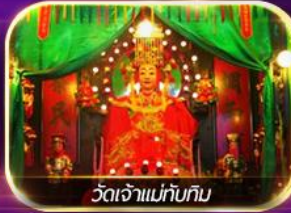
วัดเจ้าแม่ทับทิม