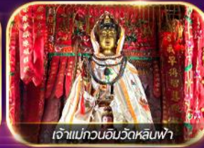
เจ้าแม่ทวนอิมวัดหลินฟ้า

เต็มอิ่มทั้งบุญ และ ซอปปิงแบบจัดเต็ม จิมซาจุ่ย มงก๊ก