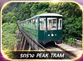
รถราง PEAK TRAM