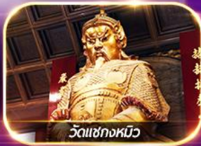
วัดเซกกงหมิว