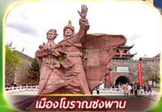
เมืองโบราณซ่งพาน