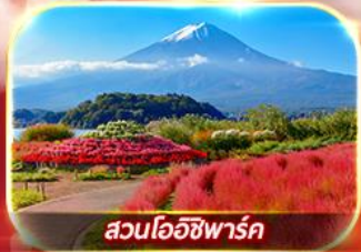
สวนโคโนชิฟาร์ก