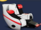
ราคาเริ่มต้นที่ 1,500 / ที่เที่ยว

Premium Flatbed ที่นั่งสุดพิเศษขนาดกว้าง 19 นิ้ว ที่ความยาวของที่นั่ง 99 นิ้ว สามารถปรับนอนได้ทุกองศาสามารถพักผ่อนได้อย่างสบายและนุ่มนวลได้จนกระทั่งถึงจุดหมายปลายทาง