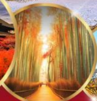
ป่าไผ่ อาราชิยาม่า