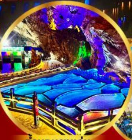
ด่านกนงาแอง