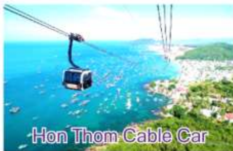
Hon Thom Cable Car