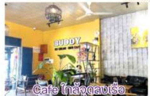
Cafe ไกล่จูดลงเรือ