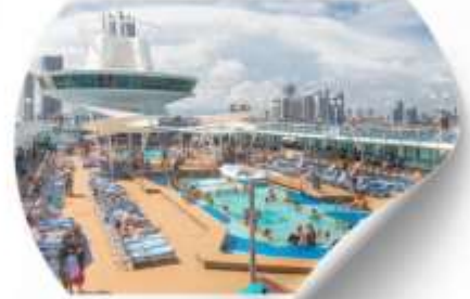
พักผ่อนบนเรือ