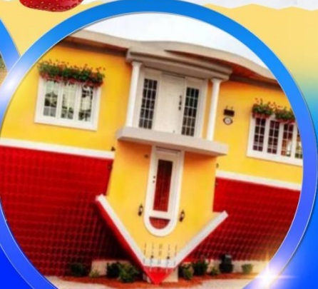
UPSIDE DOWN HOUSE