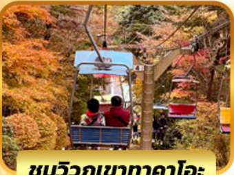
ชมวิวกูเขากาตาโอะ