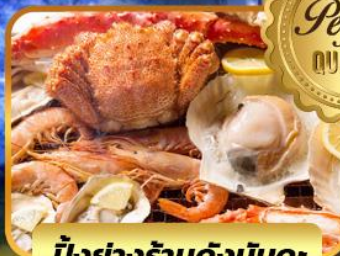
บิ๊งย่างร้านดังนั้นดะ