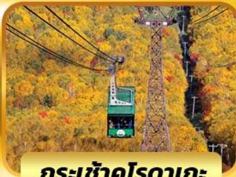
กระเช้าคุโรดากะ