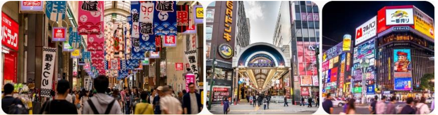
ค้ำ อีสระรับประทานอาหารค้ำ ตามอรัยาศัย