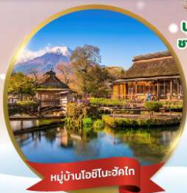
หมู่บ้านโอชิโนะฮักโกะ