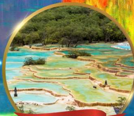
อุกยานหองหลง