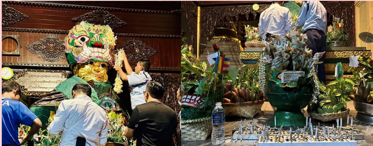
วิธีการขอพรจากแม่ยักษ์

พาท่านเดินไปขอพรที่ แม่ยักษ์ ผู้ปกป้องดูแลเจดีย์ คนพม่าเชื่อว่าแม่ยักษ์...จะช่วยในการตัดกรรมจากเจ้ากรรมนายเวร โดยเฉพาะอย่างยิ่งผู้ที่มีเวรกรรมกับเจ้ากรรมนายเวรทั้งหลายช่วยขจัดเคราะห์กรรม ขจัดอุปสรรค ติดขัดต่างๆ ความสำเร็จอธิษฐานขอให้ท่านช่วย ให้ชีวิตของคุณมีแต่ดีขึ้นเรื่อยๆ ซึ่งถ้าหากคุณกำลังมีทุกข์และหาหนทางไม่ออก ก็ลองมาไหว้ขอพรจะแม่ยักษ์ให้ช่วยบันดาลให้สิ่งร้ายๆ สิ่งไม่ดี ออกไปจากชีวิต และขอให้ชีวิตมีแต่สิ่งดีๆเข้ามา นอกจากนี้ยังเชื่อกันว่าแม่ยักษ์...ยังช่วยเรื่องความมีชื่อเสียงโด่งดัง เป็นที่รู้จักก้าวหน้าในหน้าที่การงาน ใครที่ตกงานอยู่ จุดนี้เป็นอีกหนึ่งจุดที่ต้องห้ามพลาด ปล.แม่ยักษ์จะประดิษฐานอยู่ติดกับบันไดประตูทางทิศตะวันออกค่ะ