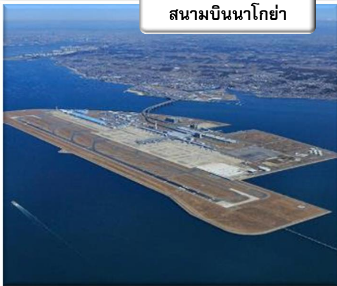
สนามบินนาโกย่า

เวลา 00.05 น. ออกเดินทางสู่ สนามบินนาโกย่า ประเทศญี่ปุ่น โดย สายการบินไทย เที่ยวบินที่ TG 644