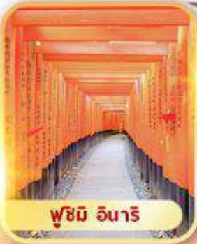
ฟูชิมิ อินาริ