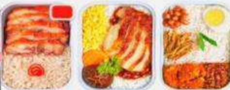
บริการอาหารร้อน ทั้งขาไป-ขากลับ