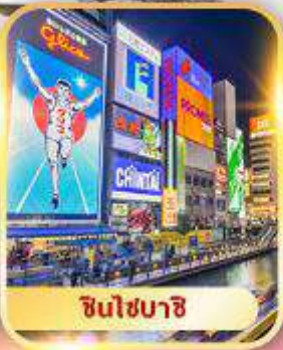
ชินโงชิม่า