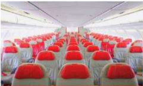
เครื่องลำใหญ่ 377 ที่นั่ง

ตัวเครื่องบินเป็นตู้กว้างสำหรับคนตัวใหญ่ ระบบของสายการบินจะทำการแรนดอมที่นั่ง ซึ่งไม่สามารถล็อกหรือเลือกกระบุนั่งได้ หากลูกค้าต้องการเลือกกระบุนั่ง ทางสายการบินมีบริการอัพเกรดที่นั่ง (ค่าบริการเป็นไปตามที่สายการบินกำหนด)