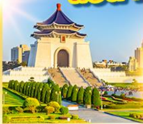
อนุสรณ์เจียงไคเช็ค

นั่งรถไฟท่องเที่ยว! ชมวิวที่ผิงซาน แช่น้ำแร่ร้อนตัวในห้องพัก