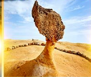
อุทยานหินเหย่หลิว