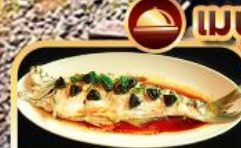
ปลาประจักษ์ริบตี