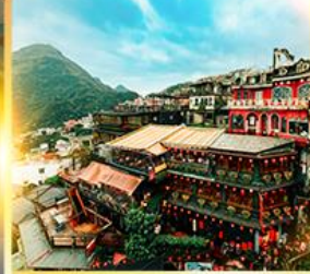
หมู่บ้านโบราณจิวเฟิน