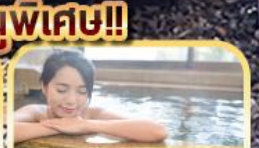
แช่น้ำแร่ร้อนตัว