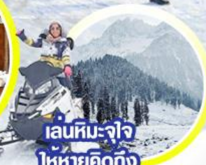
เล่นหิมะ-จ๊ว ให้หายคิดถึง