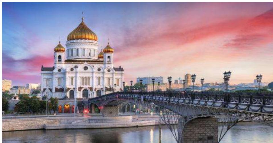
นำท่านถ่ายรูปกับวิหารเซนต์เดอซาร์เวียร์(ด้านนอก) (THE CATHEDRAL OF CHRIST OUR SAVIOUR) วิหารที่สร้างขึ้นเมื่อปี ค.ศ.1839 ในสมัยพระเจ้าซาร์อเล็กซานเดอร์ที่ 1 เพื่อเป็น