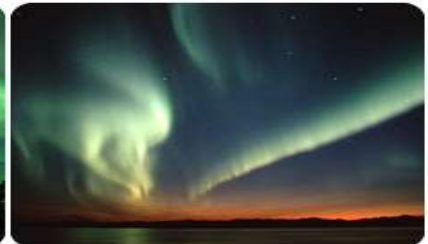
**นำท่านดูแสงเหนือ ณ ที่พัก**

*** การพบเห็นปรากฏการณ์แสงเหนือ เป็นปรากฏการณ์ทางธรรมชาติ ไม่สามารถกำหนดหรือทราบล่วงหน้าได้ โอกาสที่จะได้เห็นขึ้นอยู่กับสภาพอากาศเป็นสำคัญ โดยช่วงปลายฤดูใบไม้ร่วงจนถึงต้นฤดูใบไม้ผลิ ในเดือน ตุลาคม- มีนาคม เป็นเดือนที่เหมาะสมสำหรับการชมออโรราทางซีกโลกเหนือ มักจะเกิดในช่วงเวลาสี่ทุ่มจนถึงเที่ยงคืน และ โปรแกรมอาจมีการปรับเปลี่ยนได้ตามความเหมาะสม***