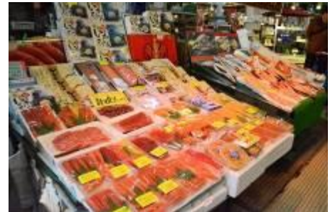
ตลาดปลาโกโจ