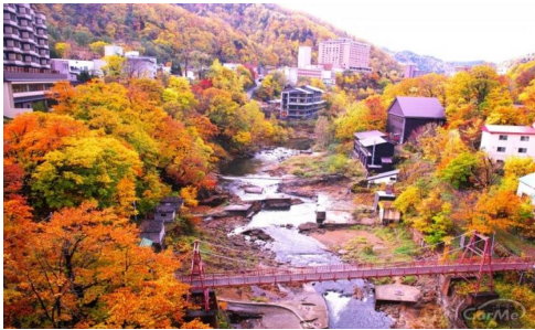
โจซังเคชมใบไม้เปลี่ยนสี