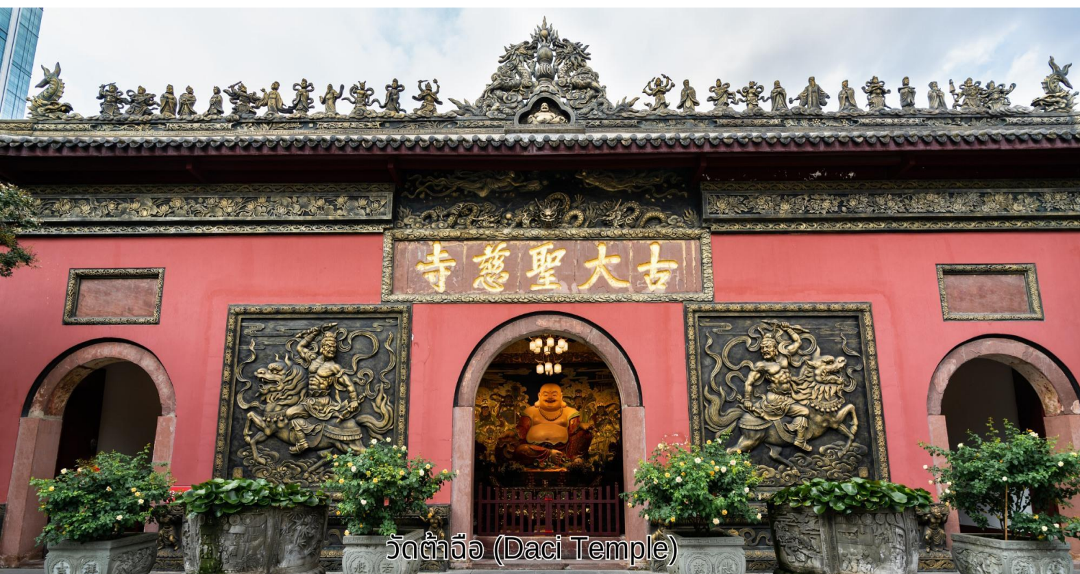
วัดต้าจื่อ (Daci Temple)

เช้า บริการอาหารเช้า ณ ห้องอาหารของโรงแรม