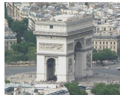
ประตูชัย ARC DE TRIOMPHE