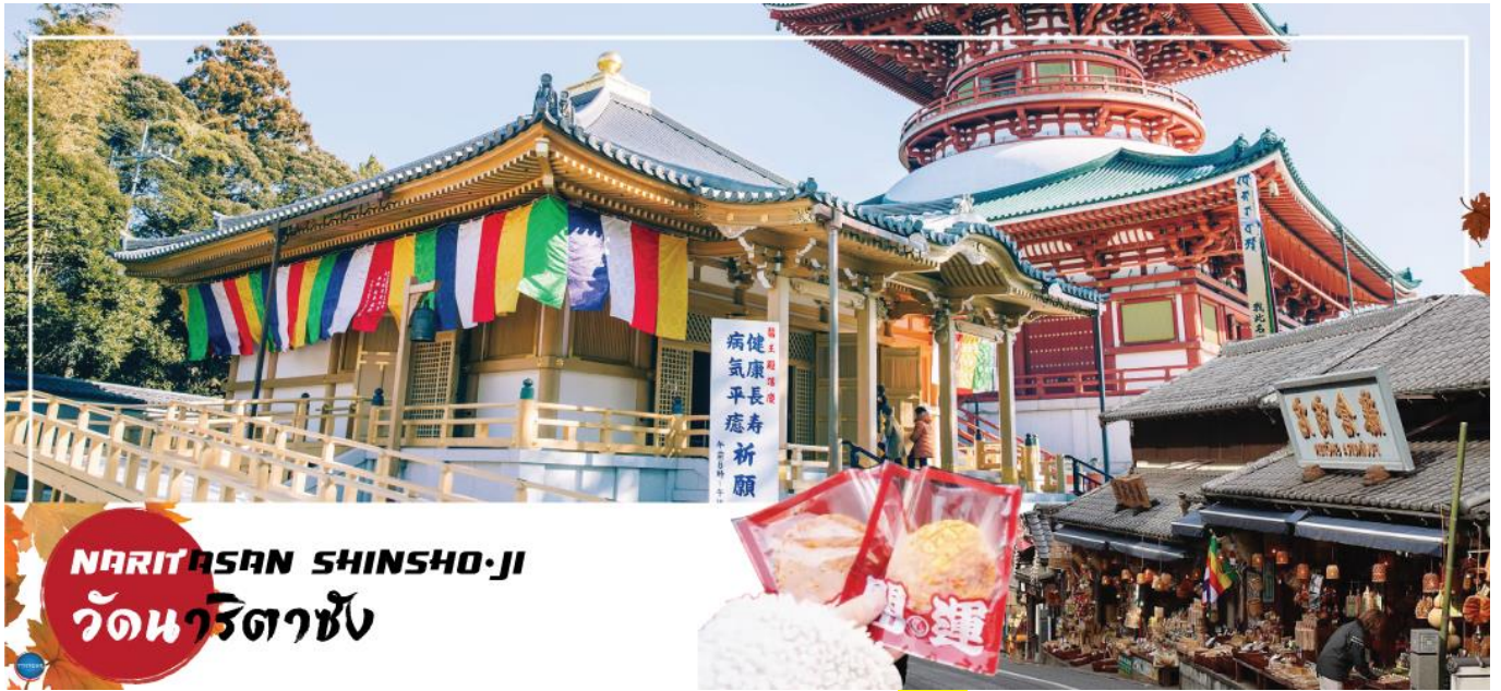
NARITASAN SHINSHO-JI วัดนาริตะชิน

วันที่หก เมืองนาริตะ – วัดนาริตะชิน – ถนนโอมโตะซังโตะ – อีออน มอลล์ – ท่าอากาศยานนานาชาตินาริตะ – ท่าอากาศยานสุวรรณภูมิ