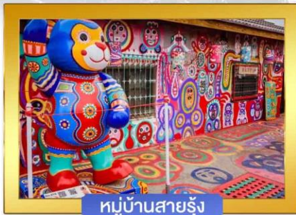
หมู่บ้านสายรุ้ง