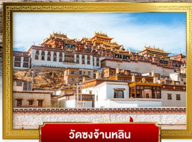
วัดชงจ้านหลิน