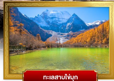
ทะเลสาบไข่มุก