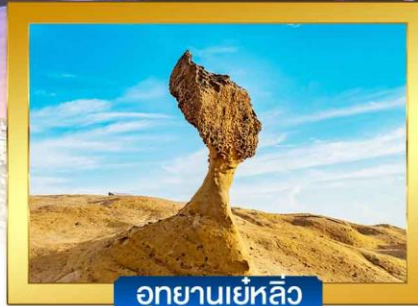
อุทยานเย่หลิว