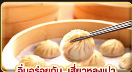
อูมอร่อยกับ..เสี่ยวหลงเปา

พิเศษ !! หม้อนึ่งจิ๋วรสดี ,ไอศกรีม MIYAHARA