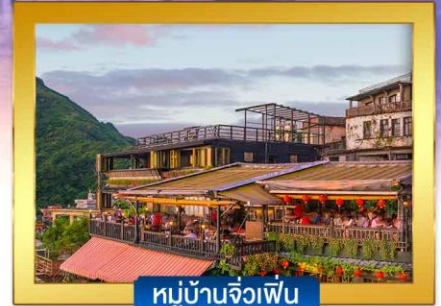
หมู่บ้านจิวเฟิน

พิเศษ !! หน่องนึ่งจักรพรรดิ, เสี่ยวหลงเปา, ไอศกรีม MIYAHARA