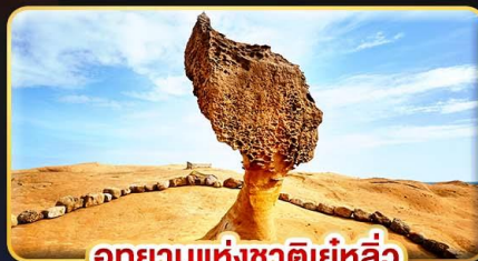
อุทยานแห่งชาติเย่หลิว