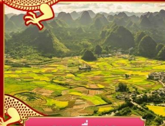
ภูเขาหมื่นยอด