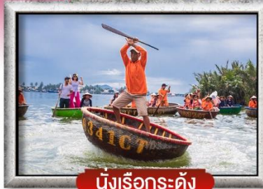
นั่งเรือกระดัง