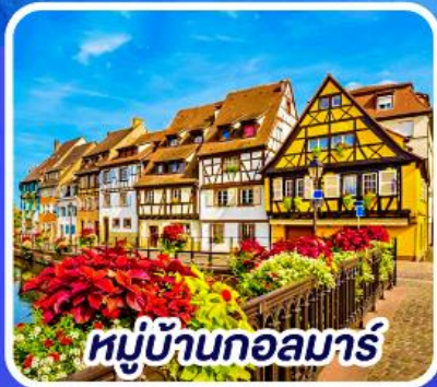
หมู่บ้านกอลมาร์