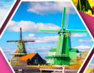
หมู่บ้านกังหันลม ชาสคินส์