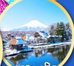
หมู่บ้านน้ำใส ไอชิโนะอัทึกิ