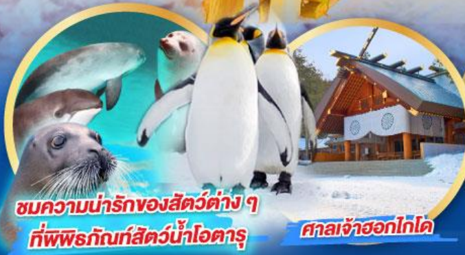
ชมความน่ารักของสัตว์ต่าง ๆ ที่พิพิธภัณฑ์สัตว์น้ำโฮตารุ