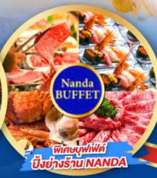
พิเศษบุฟเฟ่ต์ บึงย่างร้าน NANDA

เดินทาง (วันปีใหม่ 2568) 27 ธ.ค.-01 ม.ค. 68 29 ธ.ค.-03 ม.ค. 68