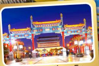
ถนนโบราณเทียนเหมิน