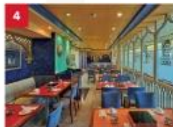
Hot Pot Enjoy your favourite noodles with an extensive list of beverages available to complement your dinner.