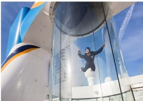
RIPCORD® BY IFLY®