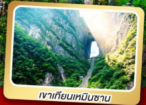
เวาเทียนเหมินซาน

ทริปเดียวเที่ยว 2 เมืองโบราณ ฝูหลงและเฟิ่งหวง ลัมรส ลุกี้เท็ด ปังย่างเกาหลี เปิดบักกิ้ง