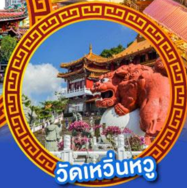
วัดเหวี่ยนหู่