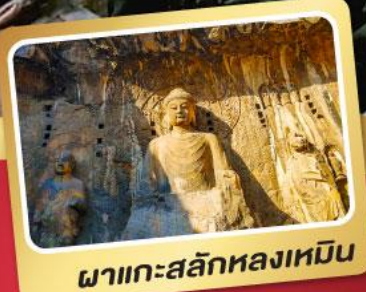
ผาแกะสลักหลงเหมิน