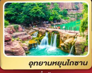
อุทยานหยุ่นโกซ่าน