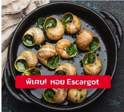
พิเศษ! หอย Escargot

เย็น ๑๑ รับประทานอาหารเย็น (มื้อที่9) เมนูพิเศษ!! หอย Escargot