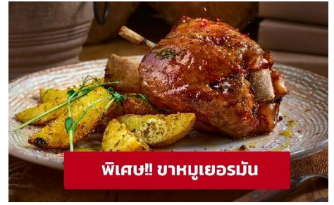
พิเศษ! ขาหมูเยอรมัน

เที่ยง ๑๑ รับประทานอาหารกลางวัน (มื้อที่6) เมนูพิเศษ! ขาหมูเยอรมัน นำท่านเที่ยวชม เมืองฟูสเซน (Fussen) ขึ้นชื่อเรื่องความสวยงามของตัวตึกรามบ้านช่องเพราะทั้งเมืองจะมีหลากสีสันทันเหมือนกับลูกกวาดสีสวยๆ ทั้งเมืองจนได้รับสมญานามว่า City of candy นำท่านเดินทางสู่ เมืองเคมป์เทิน (Kempten) (ระยะทาง 46 กม./ 1 ชั่วโมง) เป็นชุมชนเมืองที่เก่าแก่ที่สุดในเยอรมนี ให้ท่านถ่ายรูปบริเวณด้านนอก มหาวิหารเซนต์ลอว์เรนซ์ แอชวิลล์ (Basilica of Saint Lawrence) สร้างเสร็จในปี 1909 และเป็นหนึ่งในสมบัติทางสถาปัตยกรรมและจุดยึดทางจิตวิญญาณของแอชวิลล์