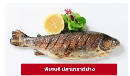
พิเศษ!! ปลาเทราต์ย่าง

ที่พัก : Gartenhotel Maria Theresia หรือโรงแรมระดับใกล้เคียงกัน (ชื่อโรงแรมที่ท่านพัก ทางบริษัทจะทำการแจ้งพร้อมใบนัดหมาย 5-7 วัน ก่อนวันเดินทาง)