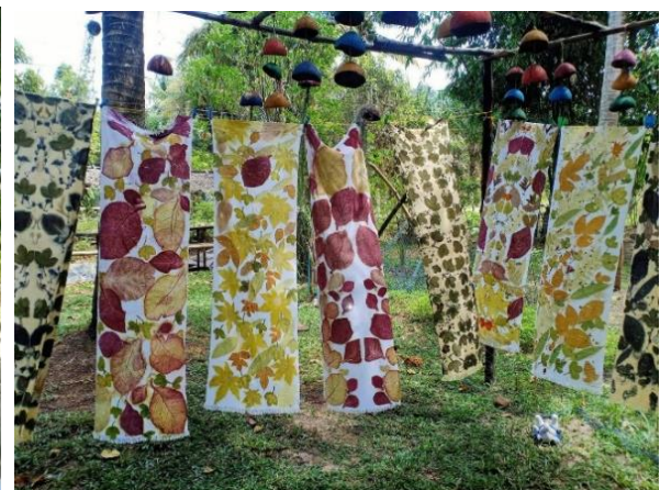
จากนั้น แวะชมศูนย์หัตถกรรมกลุ่มกะลามะพร้าว ผลิตภัณฑ์จากกะลามะพร้าว