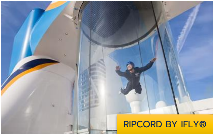
RIPCORD BY IFLY®