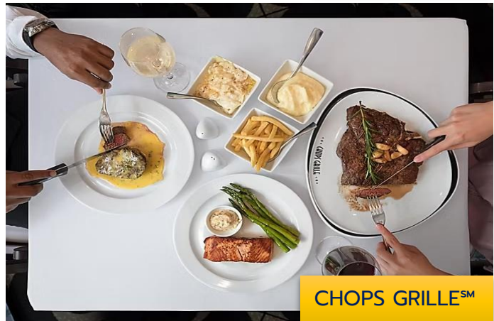
CHOPS GRILLE SM