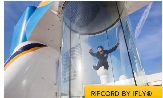
RIPCORD BY IFLY®