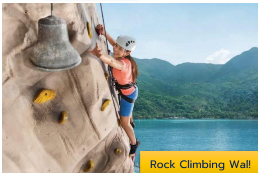
Rock Climbing Wall!