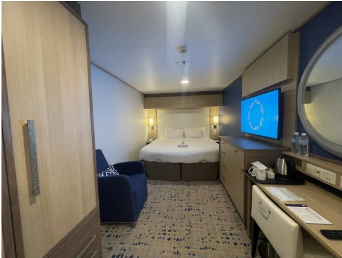
Interior ห้องไม่มีหน้าต่าง