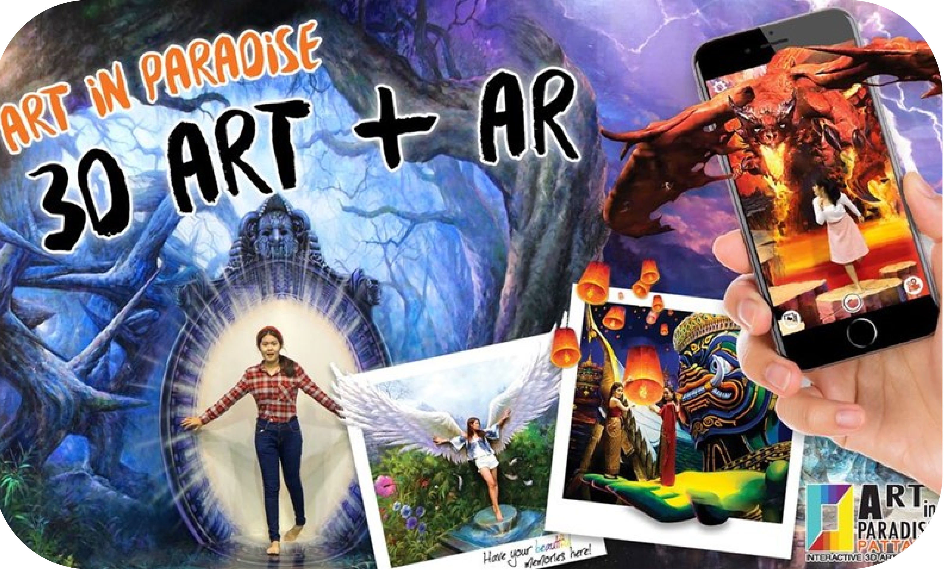
สนุกกับการถ่ายรูป 3D ที่ Art in Paradise เปิดให้บริการทุกวัน เวลา 09.30 น.-20.00 น.