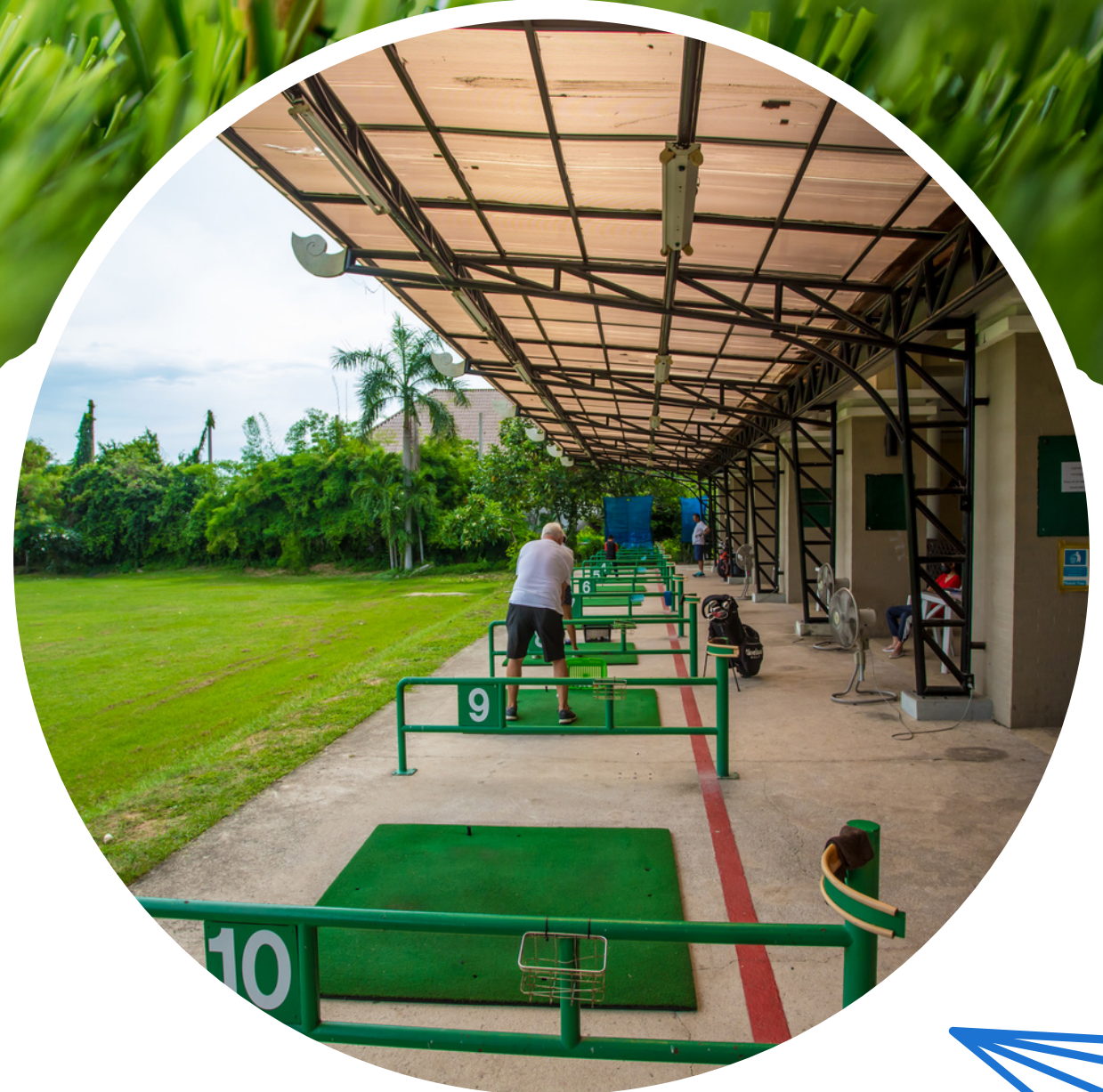
Free !! Drive Golf 1 ภาด (40 ลูก) ภาดต่อไป ลด 10 %