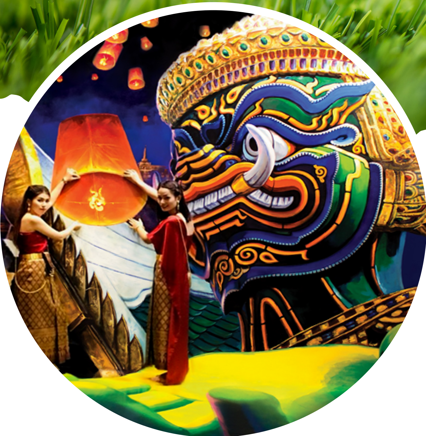
สนุกกับการถ่ายรูป 3D ที่ Art in Paradise